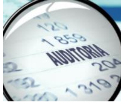
Figura 3.1 – Ilustração: Auditoria.